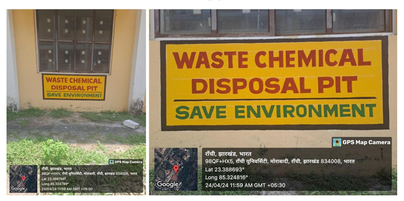
Fig. Waste Chemical Management at University Department of Chemistry, Ranchi University, Ranchi