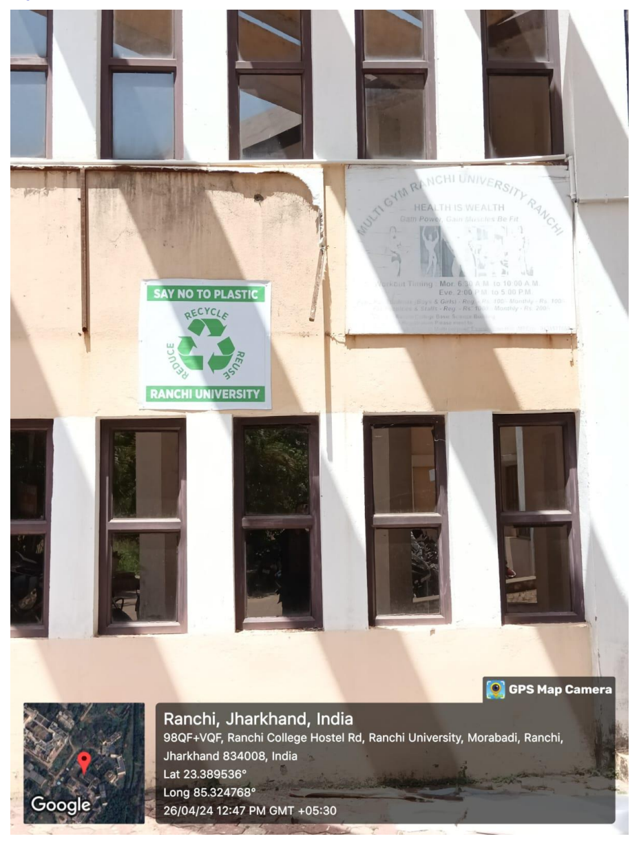
Fig. Initiative for making Ranchi University campus plastic free zone.