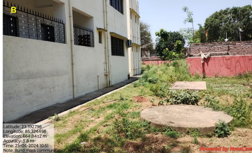
Fig. Waste Management at campus of Ranchi University, Ranchi: A. Chemical Waste Management at University Department of Chemistry; B. Closed Pit for sewage management at Mass Communication Department, Ranchi University, Ranchi