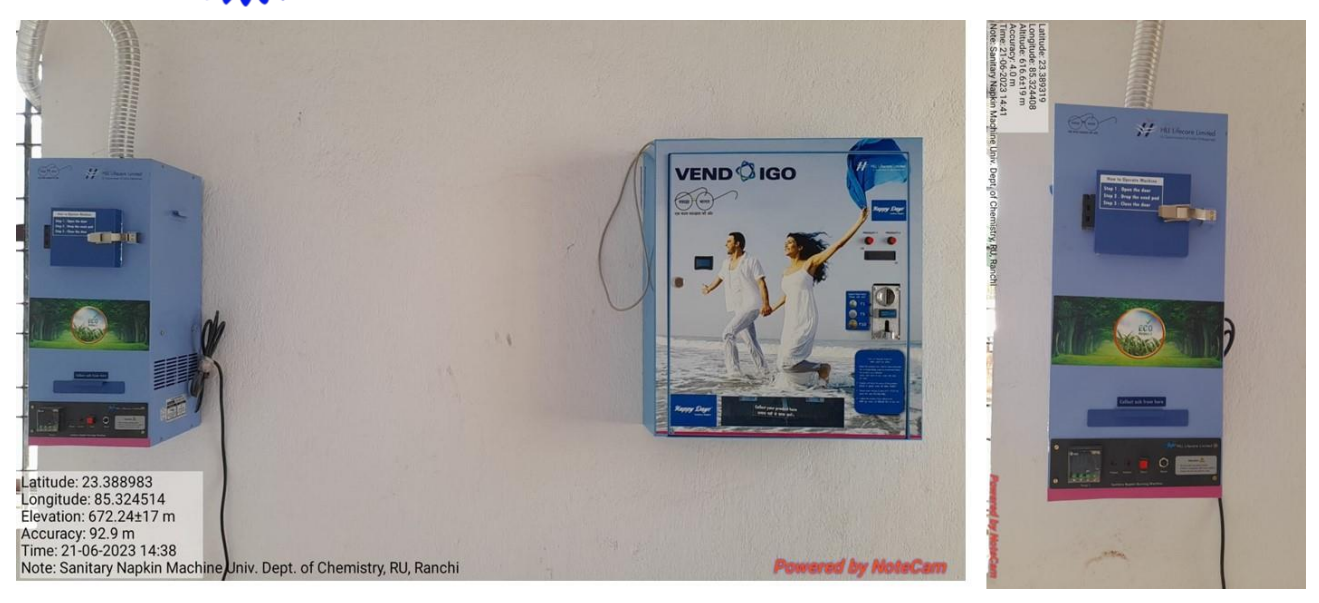
Fig. Sanitary Napkin Vending Machine installed at Various Departments of Ranchi University, Ranchi