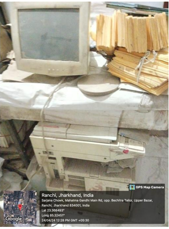
Fig. For the e-Waste management Ranchi University having MoU with MSTC Limited, Ranchi (MoU agreement copy attached below).