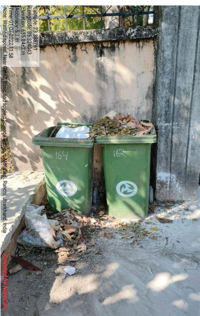
Fig. Waste disposal installed at campus of Ranchi University, Ranchi